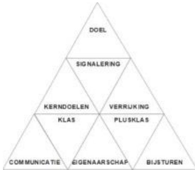
Beleidspiramide Novilo - Tijl Koenderink